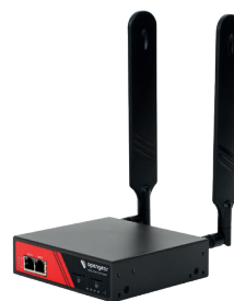
Resilience Gateway ACM7000-L

Opengear propose une gamme de matériels tous configurés avec la technologie Smart Out-of-Band™. De 4 à 96 ports consoles, des modems embarqués 4G-LTE, de la continuité de service cellulaire, la gestion unifiée de l'alimentation, des capteurs d'environnement, des alertes SMS automatisées... et le choix de la gestion centralisée Opengear LightHouse pour une plateforme toute intégrée.