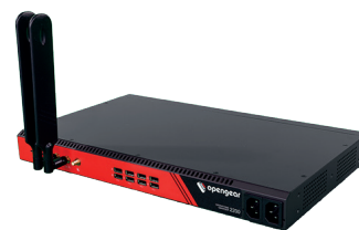
Operations Manager OM2200

Oublié le console management traditionnel, optez pour la plateforme Opengear