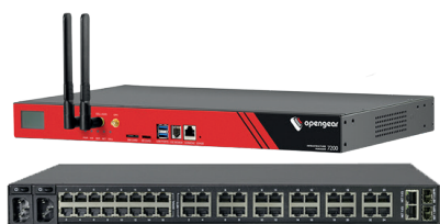
Infrastructure Manager IM7200